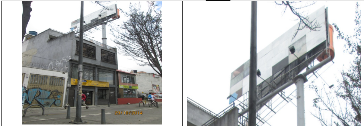
VISTA PANORÁMICA AV. BOYACA No. 74 A – 59 SENTIDO SUR - NORTE